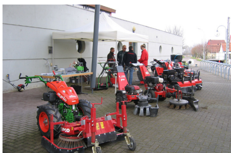
Outils de désherbage mécanique pour les communes

Elle a fixé l'interdiction d'utilisation des produits phytosanitaires au 1er janvier 2017 pour les collectivités et au 1er janvier 2019 pour les particuliers (avec toutefois des exceptions).